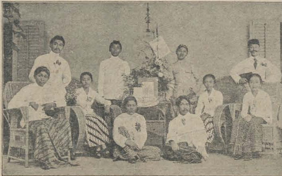
Conferentie van het bestuur van den „Inl. Journalistenbond"