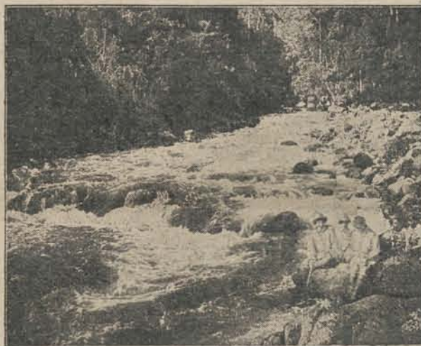
Afb. A. De rivier Tjisokan bij de Moeara Tjitjoeroeg.

houden, en nuttigden wij ons ontbijt. Een onzer nam een kiekje (zie afb. A.) Op de foto komt de Tjisokan aanbruisen. Het afgebeelde is ongeveer de helft van de ware breedte van het water. De Tjitjoeroeg komt hier van rechts instroomen, is echter op de foto niet te zien. Aangezien de tocht in den drogen tijd gedaan is, heeft de rivier maar weinig water; in den regentijd zal zij geweldig kunnen spoken. De oevers van de Tjisokan zijn steil en geheel begroeid door oerwoud, hier eindelijk eens wat ongerept. Na ons laat ontbijt werd de tocht voortgezet langs de kanten. Dat ging aan-