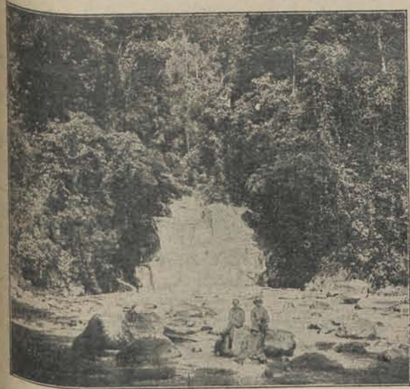
Afb. B. Een der watervallen van de Tjidadap: De Tjoeroeng Maléla.

Laat ik, ter voorkoming van verwarring, even zeggen, dat hier van een rivier Tjidadap sprake is, die een andere is dan het water van gelijken naam, dat door de onderneming stroomt, die daaraan haar naam ontleend heeft. Dit laatste, een klein nietig stroompje, staat niet op de kaarten. De Tjidadap van onzen tocht daarentegen is een breede, in den regentijd ongetwijfeld geweldige stroom; deze staat wel op de stafkaarten o. a. aangegeven.