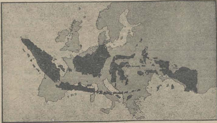
De Ned.-Indische Koloniën uitgemeten op de kaart van Europa.

*) Deze clichés zijn ontleend aan het Indië-nummer van De Amsterdamer.