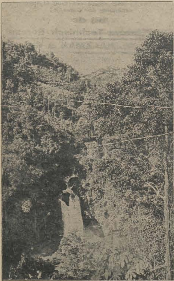
Afb. C. Een der watervallen van de Tjidadap: De Tjoeroeng Soempah.

minste niets gereed, en wachten konden wij niet, dus maar weer voorwaarts! Na een uurtje bereikten wij weer een kamponkje, Tjikembar. Hier stonden wat