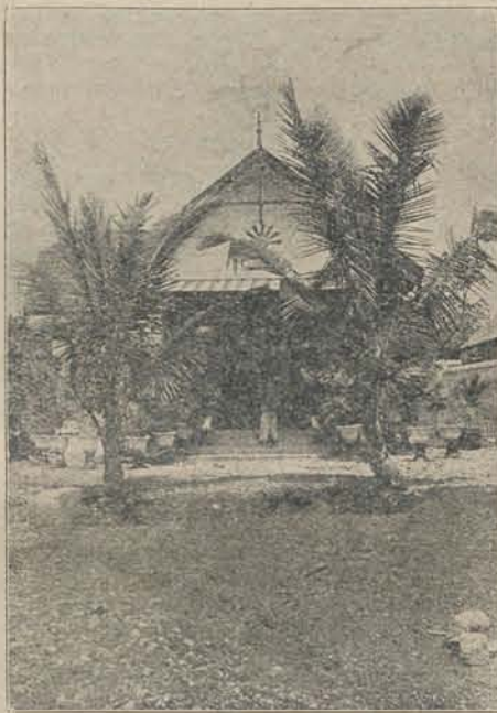
Huis van een gegoeden Chinees, die buiten de Chinese wijk woont (Bandoeng).