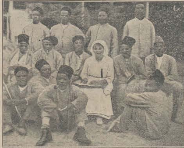
Gewonde Senegaleesche soldaten met hun verpleegster in het hospitaal te Marseille.

Beschouwt men de koloniën als een bezit, als een pacht-hoeve, wiens waarde afgemeten wordt naar zijn opbrengst, dan heeft Denemarken geen slechte zaak gedaan. De drie eilandjes brachten niets op, kosten integendeel vrij veel. Een ingevoerde hervorming was de eilanden wel ten goede gekomen, maar kon 't te kort toch in geen geval in een