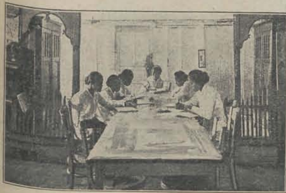
Avondstudie van de meisjes in de „pondok-moerid”, Kampong Randoesari, Semarang.

Doordat de gecorrigeerde proef te laat kwam, zijn in het desbetreffende artikel van het verslag dezer