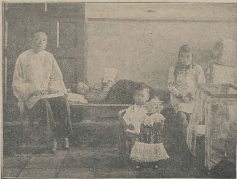
In het Prot. Zendingshospitaal te Amoy.

De Jezuiten, van hun kant, wilden zich niet neerleggen