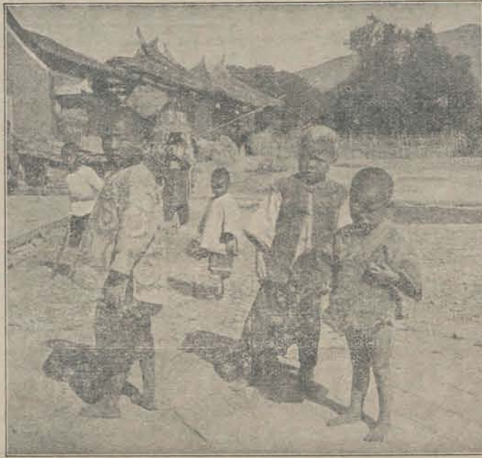
Chineesche Kinderen. *)

Toen na den val der dynastie, het gezag in handen der Mandsjoe-Tataren was gekomen, bleven zich de zendelingen in de gunst van den keizer verheugen. De eerste Mandsjoe-keizer Soentsji, gaf zelfs vergunning in Peking een kerk te bouwen, en ook in het binnenland werden bedehuizen opgericht. Behalve Jezuiten, had men in dien tijd priesters van de Dominikaner en Franciskaner orden.