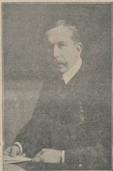
Z. Ex. Mr. J. P. Graaf van Limburg Stirum, Gouv.-Gen. van N.-I.

van saamhoorigheid worde bevorderd en gesterkt; dat meer en meer alle niet natuurlijke scheidingen vervallen; dat Nederland en Indië, waarlijk één en daardoor krachtig, door Gods zegen voortgaand groeien en bloeien onder den scepter van Oranje.