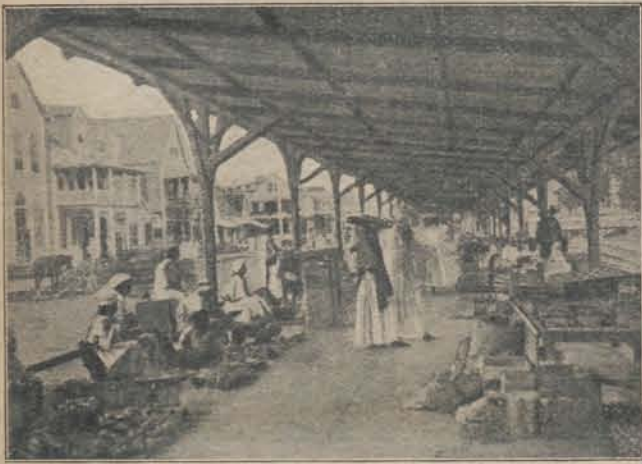
Enen stil oogenblikje. Links zitten inlandsche vrouwen bij hun koopwaar. In 't midden staat een Koelievrouw met een baskiet op het hoofd. Aan den linker kant van de straat, de Heiligenweg, zijn de Chinese winkels.

door al de leden ten zeerste betreurd. Moest eensdeels worden toegegeven, dat voor sommige begrotingsposten eene overschrijding onvermijdelijk was tengevolge van den oorlogstoestand, door prijsverhoging van voedingsmiddelen, enz., aan den anderen kant was men echter niet overtuigd en werd het zelfs sterk betwijfeld of de ambtenaren bij het aanwenden van 's lands middelen zuinigheid betrachtten, een plicht, welken zij juist thans meer dan ooit niet uit 't oog mochten verliezen.