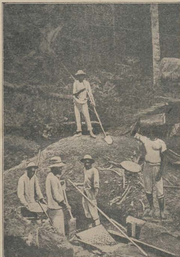
De bak is maar gedeeltelijk, de torpedo in 't geheel niet zichtbaar. Deze beviadt zich achter de schuine ijzeren plaat. De man links heeft een battée in de hand.

ten minste de kans dat het ding ten slotte ook den bezitter verveelt.