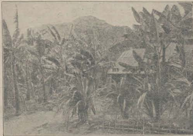
Een „grondje", beplant met bananen en suikerriet. Het wegje voert naar de met gegolfd-zinken platen gedekte woning.

De oorzaken, door den gouverneur uiteengezet, waarvan die achteruitgang moet worden toegeschreven, werden door de leden als juist erkend. Doch men meende, dat niet alléén daaraan de mindere opbrengst moest worden geweten. Naast die oorzaken schreef men dat toe, en wel voor een niet gering deel, aan de omstandigheid, dat niet krachtig genoeg wordt opgetreden voor de inning der verschuldigde belastingen en van wat uit anderen hoofde aan den fiscus toekomt. Men deed uitkomen, dat, voor zoover kon worden nagegaan, niet genoeg zorg wordt genomen om in de inkomstenbelasting aan te slaan al degenen, die volgens de verordening op die belasting behooren te worden getroffen. Aan sommigen was 't bekend dat er collectors in de balata-industrie waren, die niet of niet ten volle in die belasting hebben bijgedragen het bedrag, dat zij volgens de regelen dier verordening verschuldigd zijn. Verder werd gewezen op de door kleine landbouwers aan het gouvernement verschuldigde huur. Terwijl, naar men ingelicht was, de aan particulieren verschuldigde huur behoorlijk en vrij algemeen op tijd wordt betaald, was dit niet altijd het geval met de kleine landbouwers, die perceelen van het gouvernement in huur hebben. Velen dezer bleven de huur schuldig, waardoor de koloniale kas aanzienlijke schade leed.