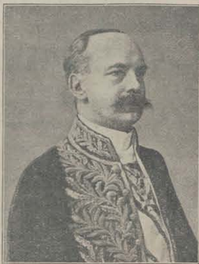
Z. Ex. A. W. F. Idenburg, Oud-G.G. van Ned.-Indië.

INHOUD: Rede, uitgesproken door den afgetreden Gouverneur-Generaal op de openbare audiëntie van 21 Maart 1916. — Rede, door den opgetreden Gouverneur-Generaal gehouden. — Het Zendingenwezen in China. — Een Huis-houdschool voor Javaansche Meisjes. — Suriname. — Wat de Inlander zegt. — Wat de Chinees vertelt. — Van Vreemde Koloniën. — Oost- en West-Ind. Lit.-Overzicht. — Leestafels. — Mededeelingen. — Naamlijst van nieuwe toegetreden leden.