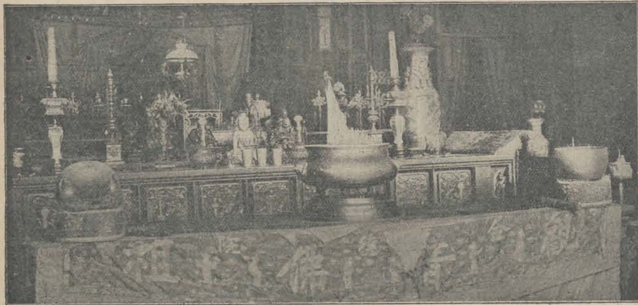
Offertafel in den Chineesche Tempel.

In gewone tijden ligt de tempel daar stil en verlaten. Een enkelen keer komt er eens iemand offeren, meest vrouwen. Zie, daar komt juist een Chineesche vrouw binnen met een klein meisje aan de hand. Zij neemt wat wierook-