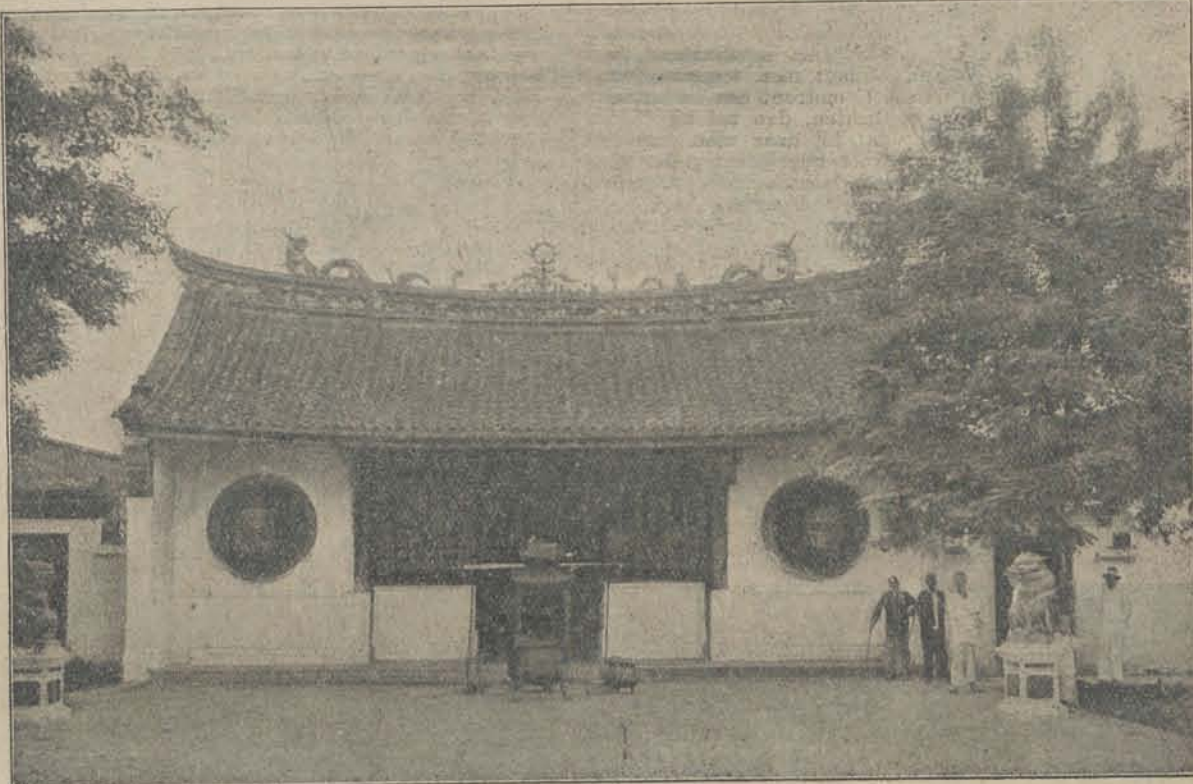
Een Chineesche Tempel te Batavia.

De eerste indruk is die van verwaarloozing en verval.