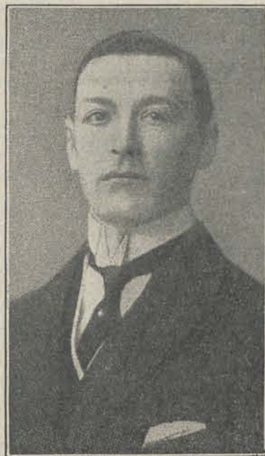
VON MÜLLER, Commandant van de „Emden”.

Soerabaja is berucht, alsoo de „Bintang Soerabaja”, wegens de vele echtscheidingen onder de Europeanen, alsook wegens allerlei ongerechtigden op zedelijk gebied. Nu worden in de bladen waarschuwingen geuit tegen Inlandsche chauffeurs aldaar, die er op uit zouden zijn jonge meisjes van Europeesche afkomst het hoofd op hol te brengen en te verleiden. Onlangs zou het dertienjarig dochtertje van den heer W. door den Inlandschen chauffeur, Din, in diens auto gelokt, in een clandestien bordeel gebracht en verkracht zijn.