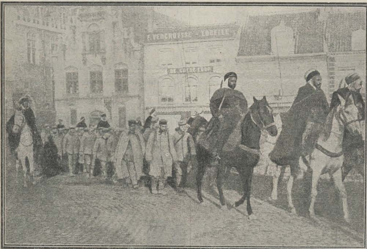
DUITSCHER KRIJSGEVANGENEN, BEGELEID DOOR ALGIERSCHER RUITERS, IN DE STRATEN VAN HET VLAAMSCHER STADJE VEURNE.

SPECIAL ADRES voor de beste Indische Ingrediënten,