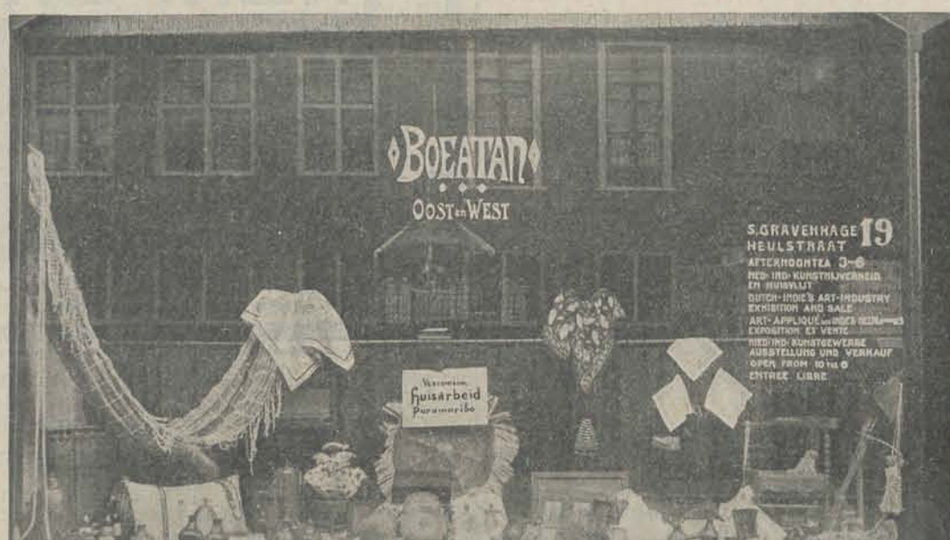
Vriendelijke Uitnoodiging tot een bezoek.

sedert eenige dagen is, gelijk reeds in de „Mededeelingen” van verleden week te lezen stond, in de lokalen van „Boeatan” een zeer belangwekkende verzameling van Surinaamsche huisvlijt-artikelen tentoongesteld, welke door de slechts voor enkele weken hier vertoevende echtgenoot van den Gouverneur uit Paramaribo werden meegebracht en afkomstig zijn van de onlangs aldaar gestichte Vereeniging „Huisarbeid.”