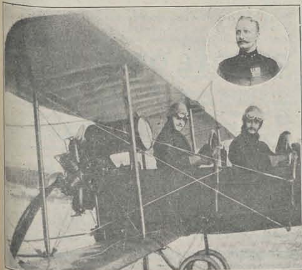
Het portret van Luitenant SPANDAW, de N.-I. aviateur, die met zijn toestel is gevallen en aan de gevolgen overleden, terwijl hij met een passagier n.l. Luitenant ANSIEAUX zich oefent in België.