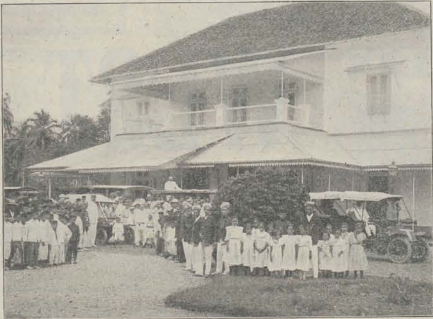
De Residentwoning te Benkoelen, welke bij de jongste ontzettende aardbeving geheel vernietigd werd.

Dezer dagen werd door de regeering goedgekeurd, dat door den directeur der havenwerken een achttal percee-