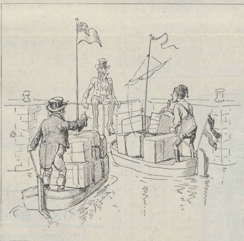
Op weg naar de Tentoonstelling van San Francisco.

Oom SAM: Wees welkom, mijn beste vrienden, JOHN BULL en MICHEL". — „Ja, maar je laat ons toch geen invoerrechten betalen?”