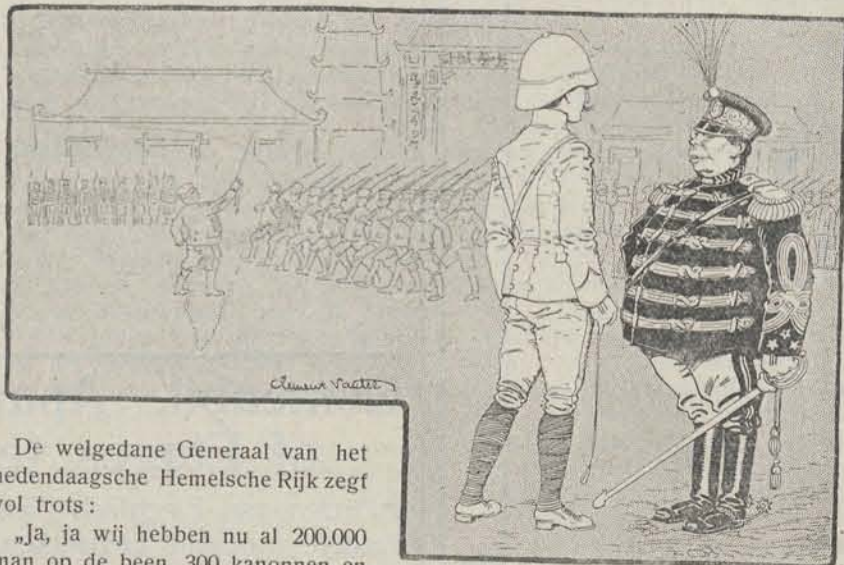
De welgedane Generaal van het hedendaagsche Hemelsche Rijk zegf vol trots:

„Ja, ja wij hebben nu al 200.000 man op de been, 300 kanonnen en de noodige schietmiddelen aangeschaft. Wij gaan snel vooruit . . . . .”