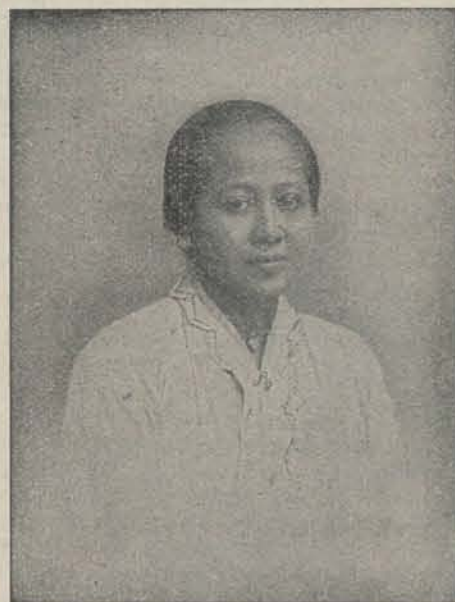
RADEN ADJENG KARTINI.