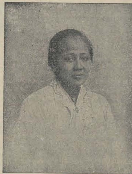
RADEN ADJENG KARTINI.