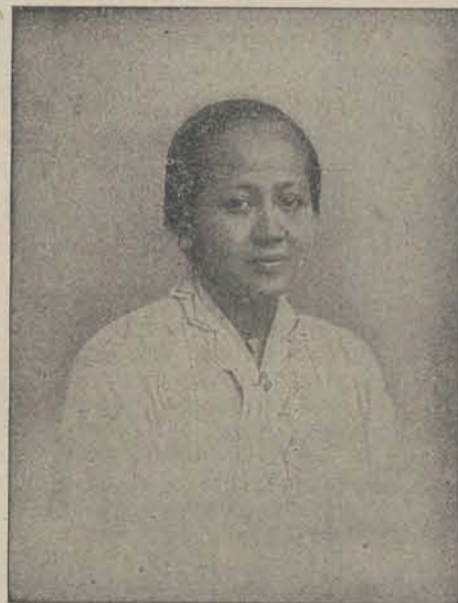
RADEN ADJENG KARTINI.

N. V. ELECTRICHE DRUKKERIJ „LUCTOR ET EMERGO“ DEN HAAG.