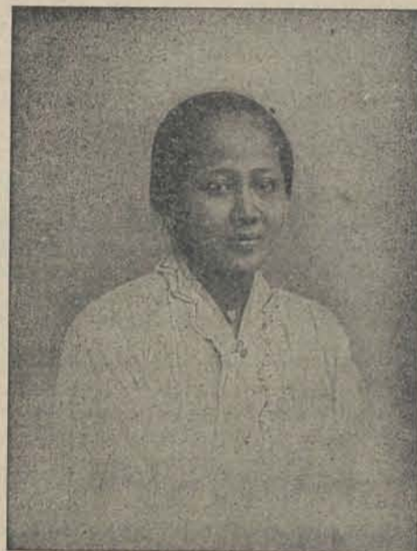
RADEN ADJENG KARTINI.