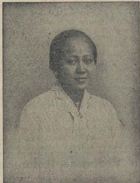
RADEN ADJENG KARTINI.