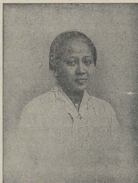
RADEN ADJENG KARTINI.