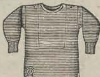
half wol f 1.35 heel wol f 2.40