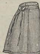
half wol f 1.35 heel wol f 2.40