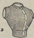
half wol f 0.65 heel wol f 1.20

GROOTE KEUZE in: NORMAAL WOLLEN en HALF WOLLEN ONDERGOEDEREN.