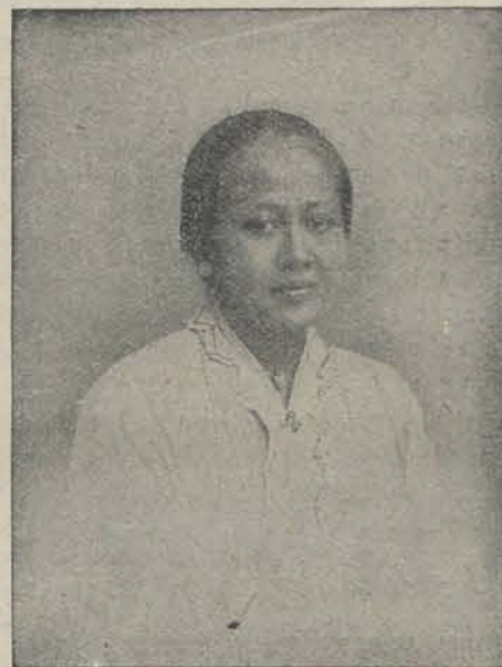
RADEN ADJENG KARTINI.