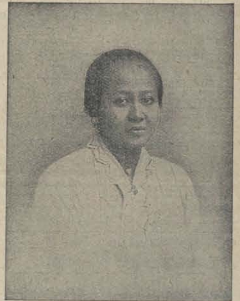
RADEN ADJENG KARTINI.

N. V. ELECTRISCHE DRUKKERIJ „LUCTOR ET EMERGO” DEN HAAG.