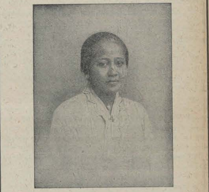
RADEN ADJENG KARTINI.