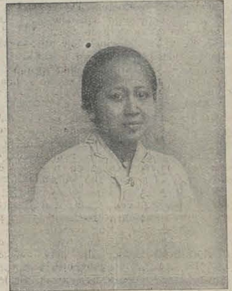
RADEN ADJENG KARTINI.

N. V. ELECTRICHE DRUKKERIJ „LUCTOR ET EMERGO” DEN HAAG.