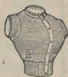
half wol f 0.65 heel wol f 1.20

GROOTE KEUZE in: NORMAAL WOLLEN en HALF WOLLEN ONDERGOEDEREN.