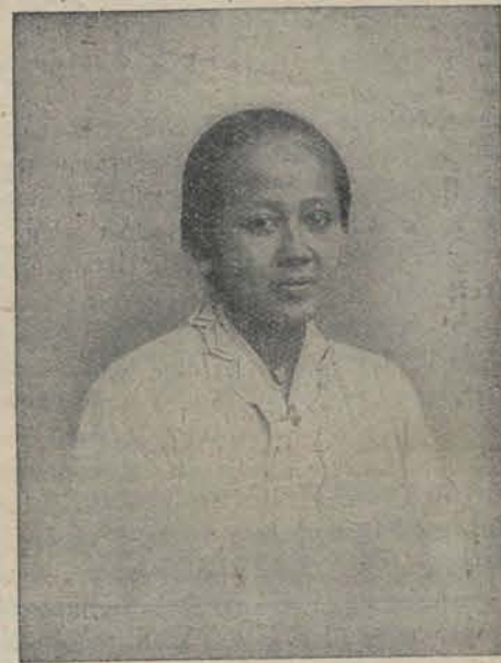
RADEN ADJENG KARTINI.

N. V. ELECTRICHE DRUKKERIJ „LUCTOR ET EMERGO” DEN HAAG.