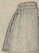
half wol f 1.35 heel wol f 2.40