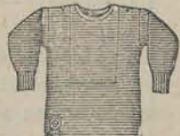
half wol f 1.35 heel wol f 2.40