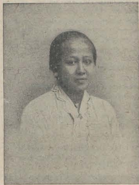
RADEN ADJENG KARTINI.

N. V. ELECTRISCHE DRUKKERIJ „LUCTOR ET EMERGO“ DEN HAAG.