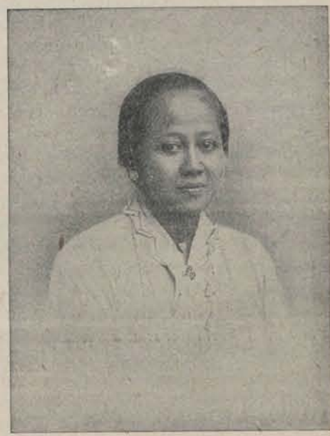
RADEN ADJENG KARTINI.

Verschenen de TWEEDE, GOEDKOOPE DRUK van: