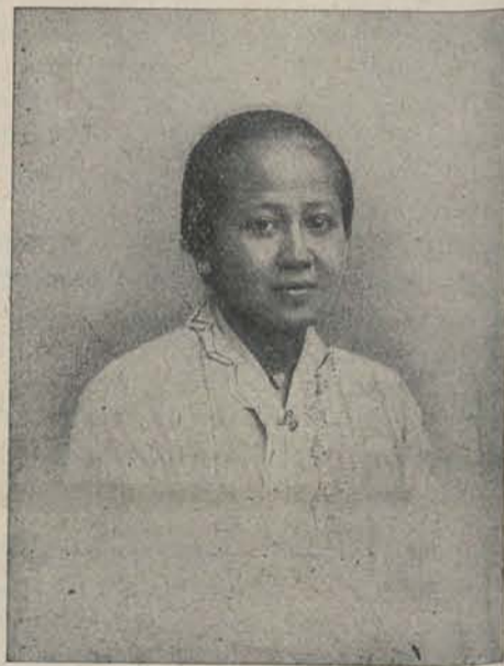
RADEN ADJENG KARTINI.

Verschenen de TWEEDE, GOEDKOOPE DRUK van: