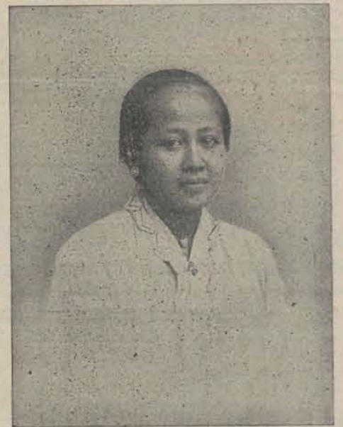
RADEN ADJENG KARTINI.

Verschenen de TWEEDE, GOEDKOOPE DRUK van: