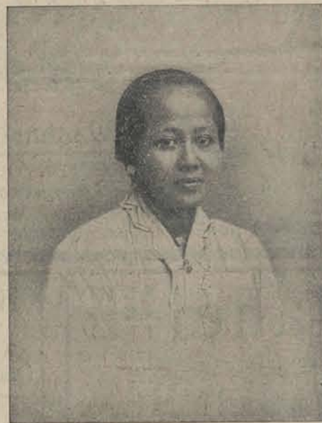
RADEN ADJENG KARTINI.

Verschenen de TWEEDE, GOEDKOOPE-DRUK van: