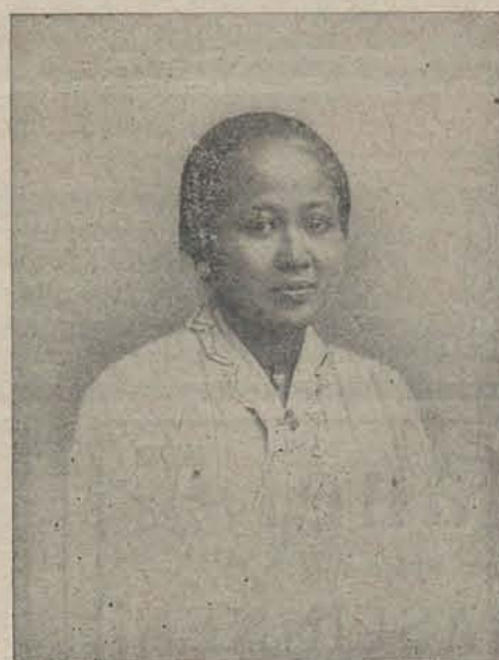
RADEN ADJENG KARTINI.

Verschenen de TWEEDE, GOEDKOOPE DRUK van: