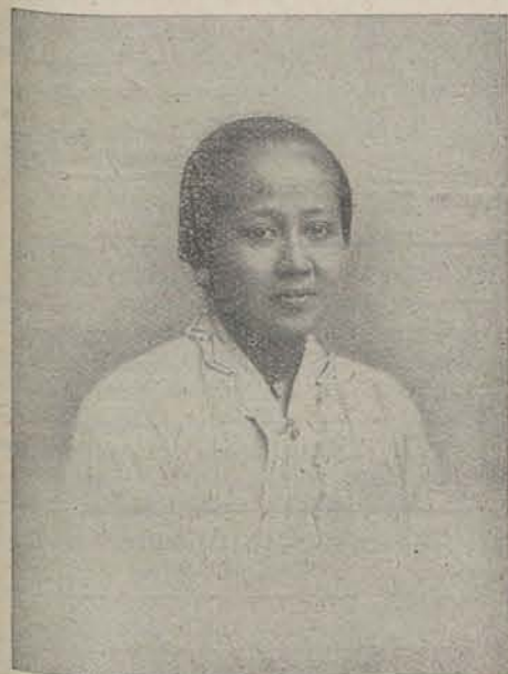
RADEN ADJENG KARTINI.

DE EERSTE DRUK, DIE IN JUNI 1911 VERSCHEEN, WAS IN ENKELE MAANDEN UITVERKOCHT.