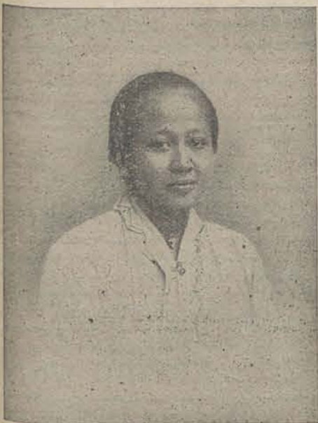
RADEN ADJENG KARTINI.

DE EERSTE DRUK, DIE IN JUNI 1911 VERSCHEEN, WAS IN ENKELE MAANDEN UITVERKOCHT.