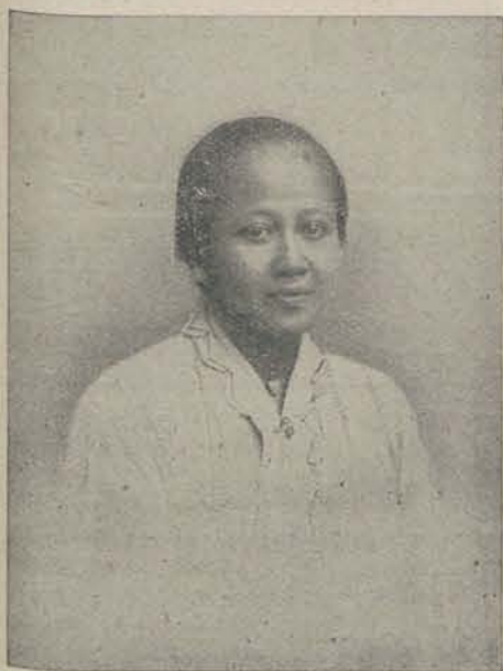
RADEN ADJENG KARTINI.

DE EERSTE DRUK, DIE IN JUNI 1911 VERSCHEEN, WAS IN ENKELE MAANDEN UITVERKOCHT.