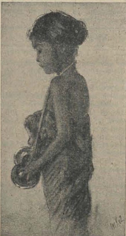
INARA, DE BEKKENSLAAGSTER.

Konden wij onzen lezers een vorig maal uit het mooie kinderboek van Mevr. Kooy van Zeggeten, DE GOUDEN KRIS dat eerstdaags ook in het Deensch verschijnt, vertaald door Emma Kraft, de door de schrijfster zoo allerliefst geteekende portretjes van de hoofdpersonen La Ballo en Andi laten zien, thans zijn wij door de welwillendheid van de uitge-