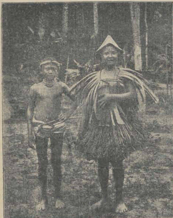
Jeugdige Mentaweiers in hun bosschen.

Naar wij in de laatste Zendingsbode lezen, is dezer dagen bij den uitgever H. J. P. Egner te den Helder verschenen „Herinneringen aan Zending August Lett, door Eleda, waarop wij later terug hopen te komen.