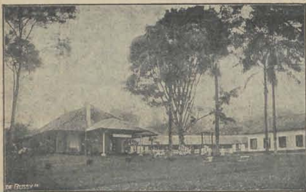
HET HUIS EN ERF.

Ook een werk van barmhartigheid — al schaat het zich niet onder de „Christelijke”, waarvan ons vorig Weekblad enkele illustraties gaf, maar daarom niet minder in den geest van Christus, die de kinderkens tot zich liet komen — wordt beschreven in een allerliefst propagandaboekje, dat ons toegezonden werd, en waaruit wij hier met de toestemming van den uitgever, J. H. de Bussy te Amsterdam, een paar kleine stukjes overnemen.