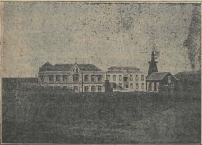
Weeshuis en Ambachtschool te Santa Rosa.

In het jaar 1634 werd dit eiland door Van Walbeek voor Nederland in bezit genomen en met uit-