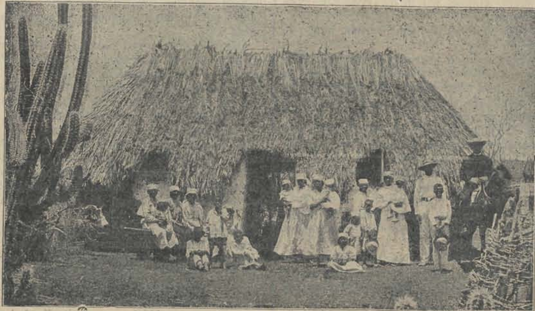
NEGERHUT BIJ MONTANE, links op den voorgrond cactusplanten.

Amerika. Meer heil zou te verwachten zijn van het bevorderen der handelsbetrekkingen, daar hiervoor het land meer geëigend is. De gunstige ligging en de in alle weer toegankelijke haven zijn nog altijd veel waard, als er maar partij van getrokken wordt.