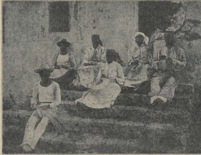
(Zagen wij in ons eerste geïllustreerde nummer de dames-vlechters te Amsterdam, hier zien wij de bevolking op het eiland aan het werk).

den landbouw te brengen zijn en buitendien zouden de resultaten daarvan ook al heel poover zijn vooral vergeleken bij die van de vruchtbare kusten van Zuid-