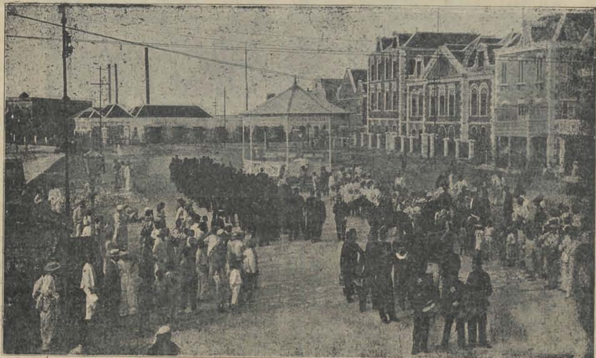
MOLENPLEIN, met het garnizoen van een oefening terugkeerend.

Het staat wel vast, dat er dan groote veranderingen in het wereldverkeer zullen plaats vinden, zij 't ook in mindere mate als destijds bij de opening van het Suezkanaal. De Westkust van bijna geheel Ame-