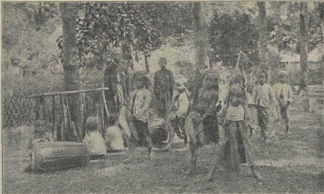
Bewaarschoolkinderen te Modjo-Warno.

In verband hiermede trof ons het aardig kiekje *) van de bewaarschoolkinderen, die k o e d a k e p a n g