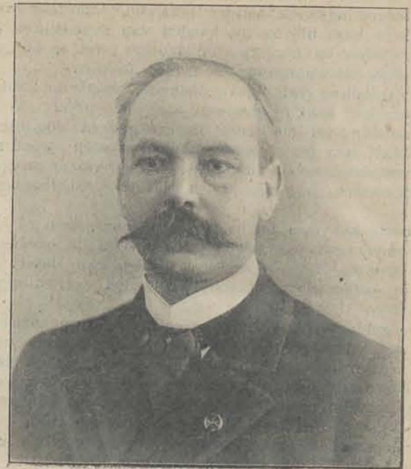
Gouv.-Gen. A. W. F. IDENBURG.

In de laatste tien jaren viel een voortdurende vermindering te constateeren ten opzichte van het op de fransche begrooting uitgetrokken bedrag voor de koloniën. Dit verschijnsel ging samen met een constante uitzetting der begrootingen voor de verschillende koloniën, zoodat het totaal der uitgaven voor alle koloniën te zamen, Algiers en Tunis niet inbegrepen, van 114 miljoen francs in 1897 steeg tot 285 miljoen in 1909.