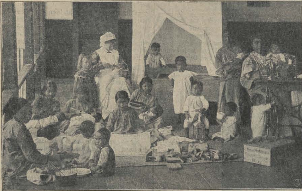
In het Kinderhuis te Pea-Radja.

Dit zijn slechts enkele illustraties uit het rijk verlichte werk, dat wij den in Ned.-Indië belangstellenden warm ter lezing aanbevelen.