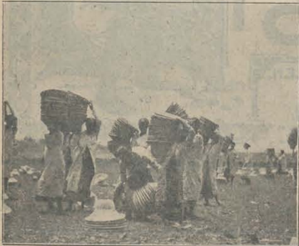
Inzameling der na de bleeking op het veld gedroogde hoeden.

Nadat de groene bast is afgeschraapt, worden de halmen in de zon gedroogd. Is het sap onvoldoende opgedroogd, dan wordt de bamboe bij de geleidingen afgezaagd. Hierna worden deze stukken in reepen gespleten, en deze weder in zeer dunne laagjes verdeeld. Het binnenste gedeelte (a-t-i-b-a-m-b-o-e) is onbruikbaar. Die dunne laagjes worden weder alzonderlijk fijn geschaafd en daardoor nog dunner gemaakt. Dit splijten en schaven (paoet) geschiedt door middel van een vlijmscherp, dun pennemesje. Zijn de laagjes glad en fijn genoeg, dan worden ze weder in reepjes van ongeveer 1 m.M. breedte gesplitst (djoegoel) met behulp van een stukje scherpe bamboe.