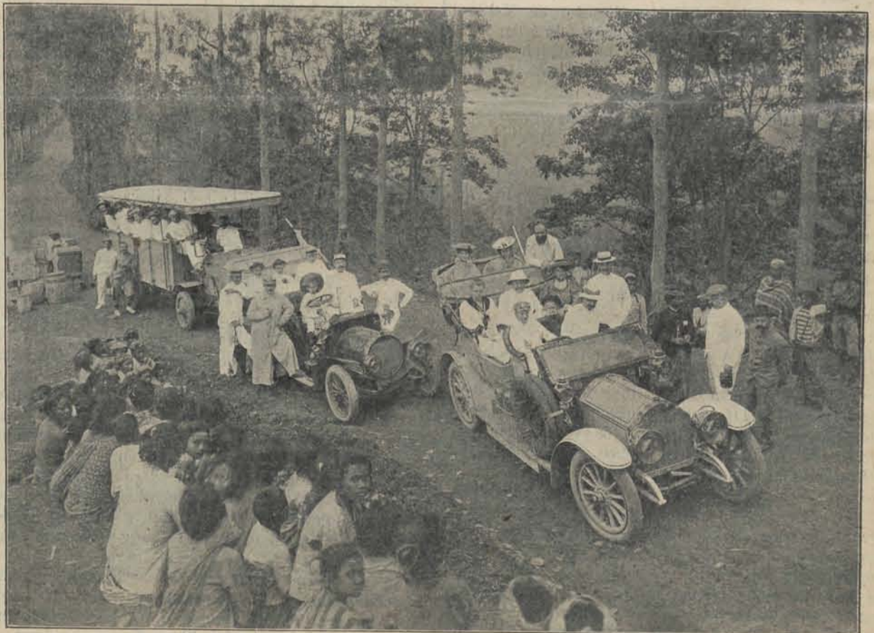
BEKLIMMING VAN TOSARI.

Die stijging was wel niet aan alle koloniën gemeen. Onder de zoogenaamde oudere koloniën zijn er, waar geleidelijke achteruitgang viel waar te ne-