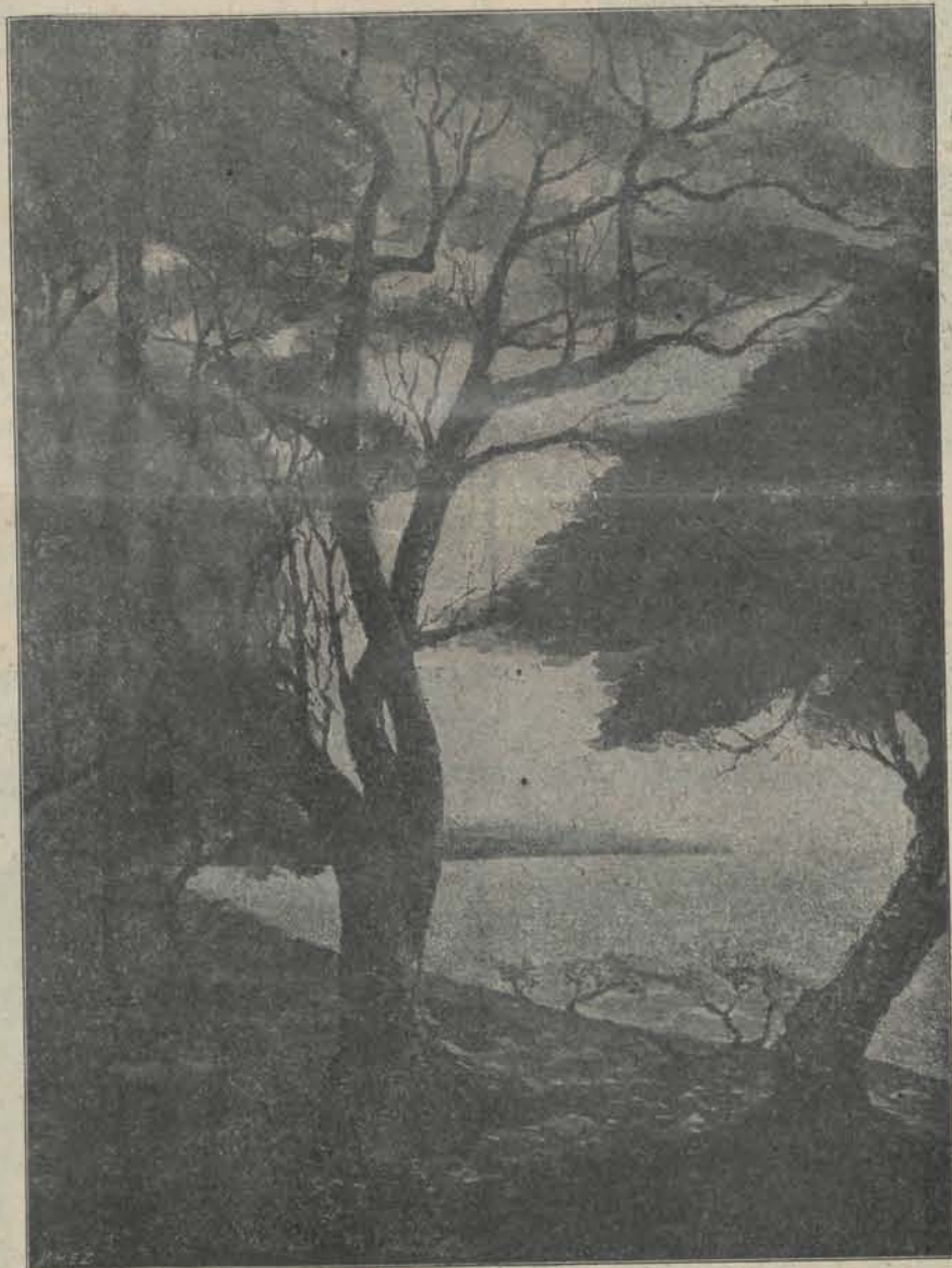
Strand van Menado. — Aquarel van Mas Pirngadi.

Den 9en Dec. II, werd het ontwerp tot verhooging der inkomstenbelasting met algemeene stemmen aangenomen, nadat een amendement daarop door de Koloniale Staten met 7 tegen 3 stemmen werd goedgekeurd, waarbij een andere schaal om de belasting te heffen werd vastgesteld dan door het bestuur was voorgesteld.