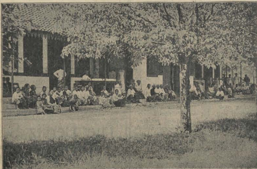
Hoofgebouw met poliklinische patiënten te Modjo Warno.

gebrek aan zorg. En zelfs waar bij de Christenen welgemeende pogingen in het werk worden gesteld om het kind in het leven te houden, gelukt dit meestal niet. Versche melk is ook in den regel niet voorhanden, men moet zich met bussemelk behelpen.