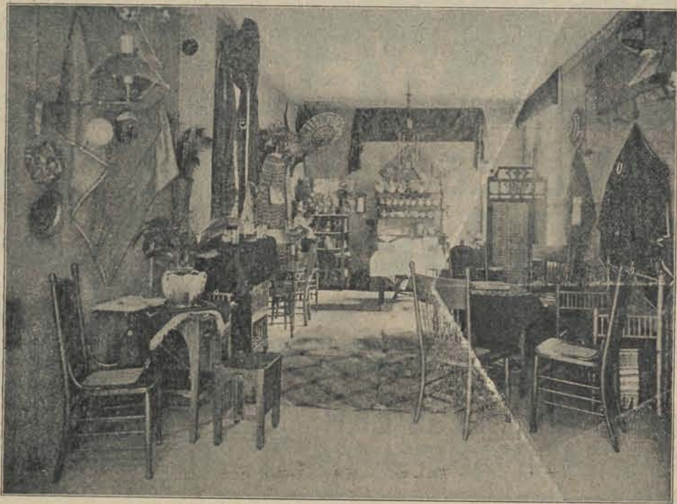
Achterzaal Heulstraat 19, den Haag, waar men iederen middag van 3—6 (behave Zondags) thee kan drinken met Indisch gebak.

Herhalende wat wij reeds in het vorige Weekblad schreven: